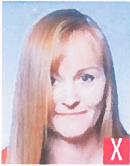
capelli sugli occhi