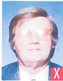
riflesso del flash sulle lenti