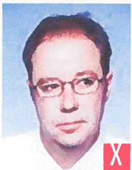
sguardo rivolto di lato