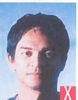
ombre sul viso