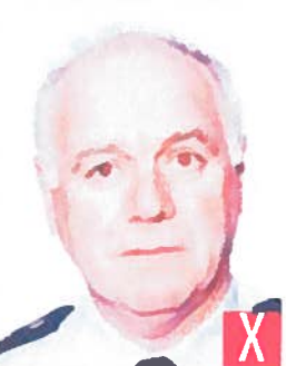
effetto occhi rossi