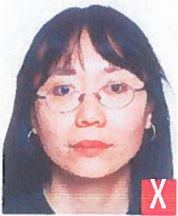
montatura che copre gli occhi