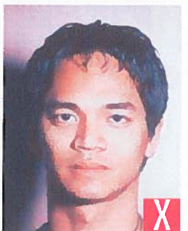
ombra dietro la testa