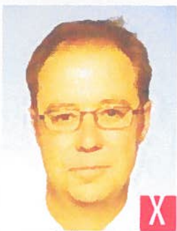
tonalità innaturale della pelle