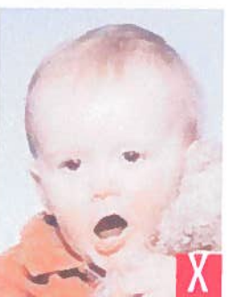
bocca aperta e giocattolo troppo vicino al viso