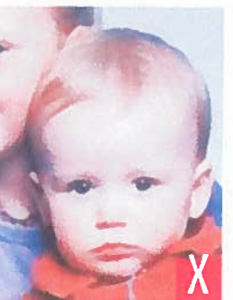
presenza di altra persona