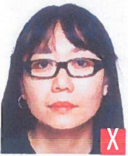
montatura troppo pesante