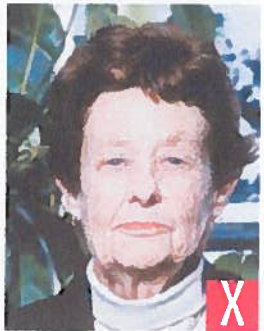
sfondo non a tinta unita