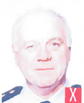
riflesso del flash sulla pelle